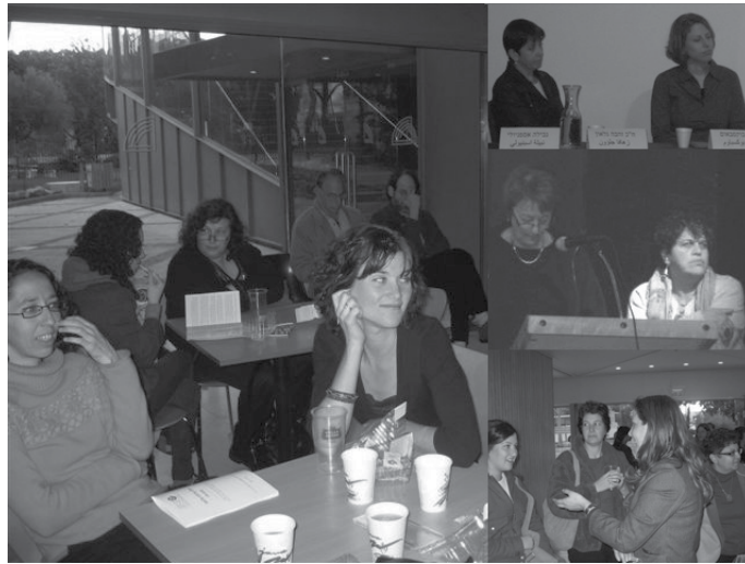
כנס אלטרנטיבי - חוסן וביטחון למי? 2007

לכלי לחימה, אימונים צבאיים, כבישים עוקפים, חומה בצורה, שכלול הגרעין. אז איך זה שכה הרבה אזרחים, תושבים, מכל עדה, גזע, לאום ומין, חווים ייאוש ומאבדים תקווה, מתכוננים בדריכות למלחמה הבאה, בעודם עסוקים מדי יום ביומו בקשיי פרנסה, פחדים, אחוזי אימה, שמא יושלכו גם הם החוצה, יוותרו מובטלים, או מתקיימים ממשכורת שלא מאפשרת חיים הגונים.