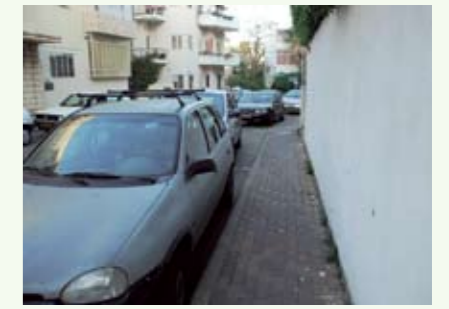
רחוב מסדה شارع مساده