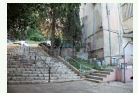
מדרגות כורש - מעבר בטוח درج كوريش • مرآمن