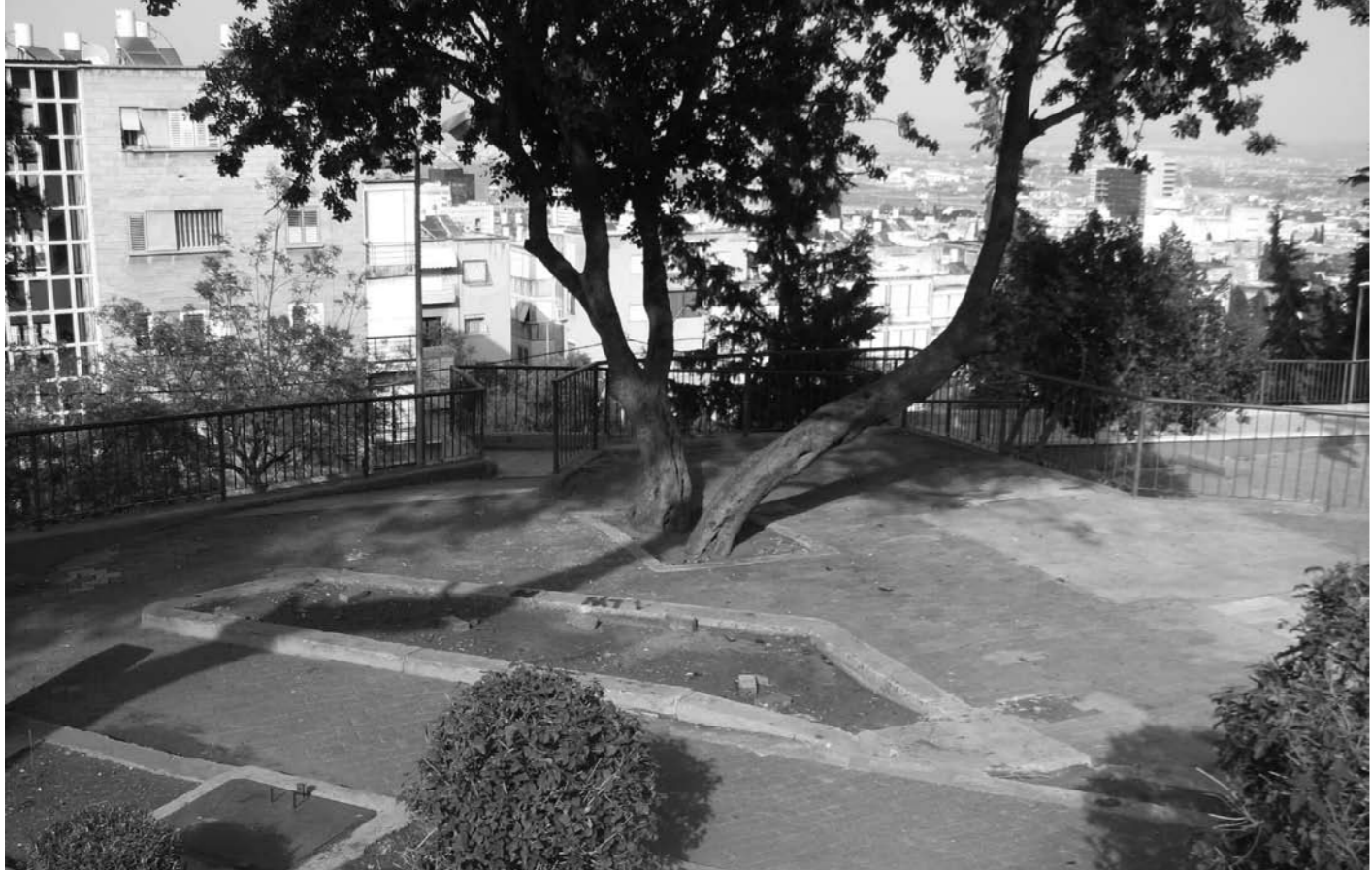
רח' הלל פינת שדרות הציונות

لقد قدم مركزوا شبيبة عدة مرات خلال فترة الصيف في العام الفائت شكاوى للشرطة بخصوص مقاصف في الحي تبیع المشروبات الكحولية لأطفال أعمارهم لم تتعدى ١٨ سنة, ولا زال الوضع على حاله بدون أي تغيير.