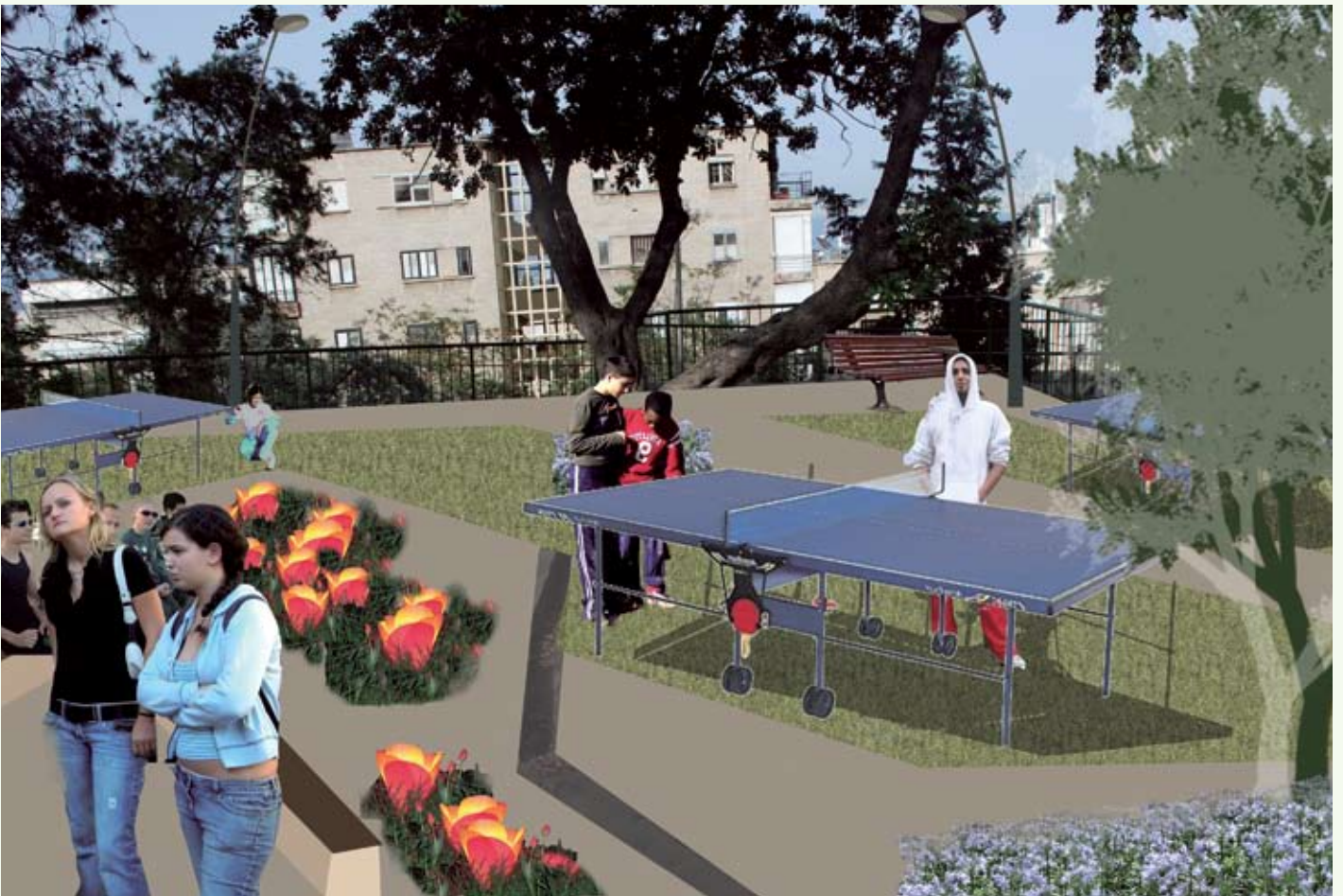
גן ציבורי - רח' הלל פינת שדרות הציונות حديقة عامة • شارع هلال زاوية شارع الجبل

اقتراحات للتدخل وإعادة تفعيل المساحات الإشكالية