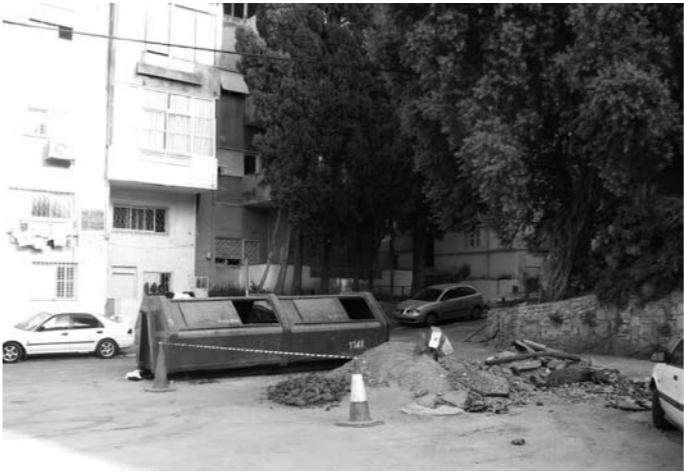
רח' בן יהודה (מתחת לגן הזייתים), מפגע זה עמד כך במשך מסי' חודשים شارع بن يهودا. أسفل حديقة الزيتون (يستمر هذا الضرر بالتواجد منذ عدة اشهر)

إهمال صحي، نفايات، روائح مجاري كريهة وغياب عناية البلدية للموافق الصحية العامة والخراب المتروك يزيد من الشعور بالغبرة والعنف في الحي، مبعدة التفاعل الشخصي والجماهيري من الحيز العام للحي، وذلك بالإضافة إلى استقطابها لأنواع أخرى من العنف والتوحد. لا تكاد الإضاءة في الشوارع تكون بكافية، هنالك بعض الزوايا في الشوارع تبقى غير مضاءة وفي بعض الشوارع معينة يوجد خلل خطير في الإضاءة. تحيط بمعظم مداخل هذه البنايات نباتات عالية وكثيفة، تحجب الرؤية عن ما يمكن أن ينتظر من ورائه هذه الجدران النباتية، الأمر الذي يضي على النساء المارات في الشارع المزيد من الشعور بعدم الأمان. فمن الجدير أن تحاط هذه المناطق بالذات بإضاءة ذات جودة عالية.