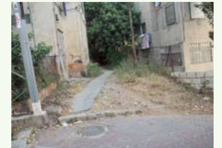
המרחבים שבין... المساحات الوسيطة