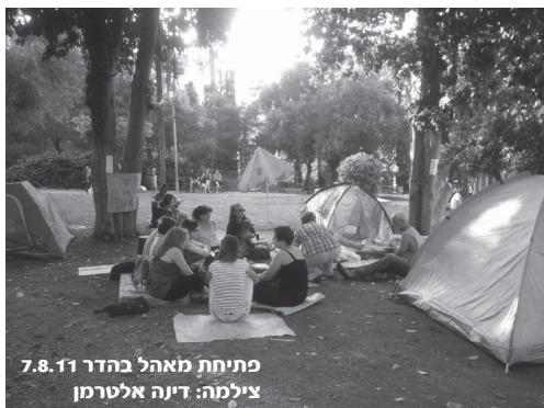
פתיחת מאהל בהדר 7.8.11

כפמיניסטית רדיקלית, הפעולה הפוליטית, ההגות והמחקר שלי הם תמיד מכוונים על ידי חזון, על ידי ראיית עתיד אחר, עולם שונה. מחאת האוהלים חשפה את חולשתו של החזון הפמיניסטי שלנו. אולי זה הזמן לשרטט את קווייה של מציאות אלטרנטיבית, השואבת מראיית עולם פמיניסטית ומחוויות נשים וההולמת את חייהם של נשים כגברים (ומדובר כמובן בלשון רבות: חזונות, עולמות, תמונות, חוויות). אולי זו המשימה הדחופה העומדת לפתחן של פמיניסטיות וארגונים פמיניסטיים כיום.